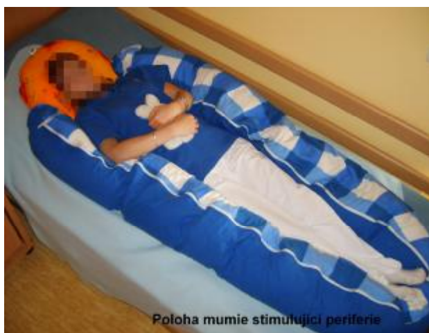
Poloha mumie stimulující periferie